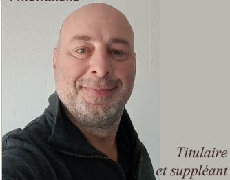
Titulaire et suppléant